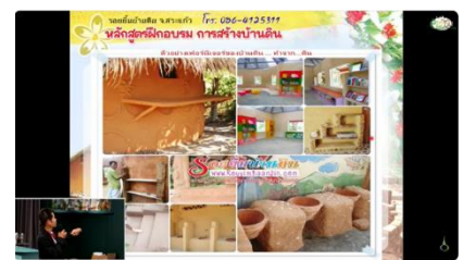
Live วิชาของหมื่นล้าน | ทำจาง สร้างงาน