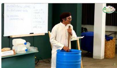
Live วิชาของหมื่นล้าน | "ชา" และกาแฟต่างถิ่น