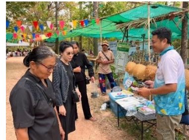
ศูนย์เรียนรู้เครือข่ายพิพิธภัณฑ์เกษตรเฉลิมพระเกียรติพระบาทสมเด็จพระเจ้าอยู่หัว จังหวัดขอนแก่น “สวนอเนกญา”