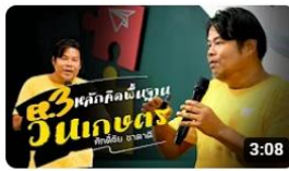
[องค์ความรู้วิชาของแผ่นดิน] EP 3 หลักคิดพื้นฐานวนเกษตร พิธีกรณัฏการเกษตรเฉลิมพระเกียรติฯ การดู 163 ครั้ง • 7 วันที่ผ่านมา