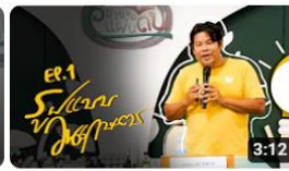
องค์ความรู้วิชาของแผ่นดิน : วนเกษตร คืออะไร พิธีกรณัฏการเกษตรเฉลิมพระเกียรติฯ การดู 232 ครั้ง • 4 สัปดาห์ที่ผ่านมา