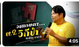
องค์ความรู้วิชาของแผ่นดิน : วนเกษตร คืออะไร EP.2 พิธีกรณัฏการเกษตรเฉลิมพระเกียรติฯ การดู 290 ครั้ง • 3 สัปดาห์ที่ผ่านมา