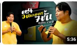
[องค์ความรู้วิชาของแผ่นดิน] EP 4 ออกแบบป่าวนเกษตร 7 ชั้น พิธีกรณัฏการเกษตรเฉลิมพระเกียรติฯ การดู 325 ครั้ง • 2 สัปดาห์ที่ผ่านมา