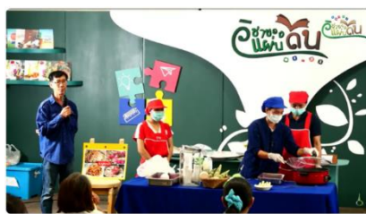
Live วิชาของหมื่นล้าน | เก็บถาวรจากอินเทอร์เน็ต