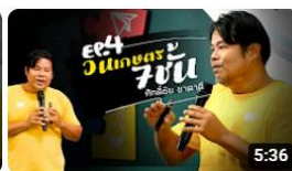
[องค์ความรู้วิชาของแผ่นดิน] EP.4 ออกแบบป่าวนเกษตร 7 ชั้น พิพิธภัณฑ์การเกษตรเฉลิมพระเกียรติฯ การดู 325 ครั้ง • 2 สัปดาห์ที่ผ่านมา