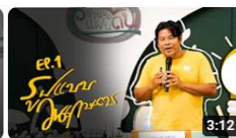
องค์ความรู้วิชาของแผ่นดิน : วนเกษตร คืออะไร พิพิธภัณฑ์การเกษตรเฉลิมพระเกียรติฯ การดู 232 ครั้ง • 4 สัปดาห์ที่ผ่านมา