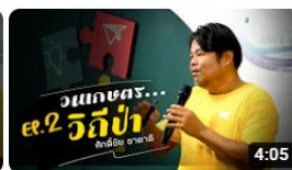
องค์ความรู้วิชาของแผ่นดิน : วนเกษตร คืออะไร EP.2 พิพิธภัณฑ์การเกษตรเฉลิมพระเกียรติฯ การดู 290 ครั้ง • 3 สัปดาห์ที่ผ่านมา