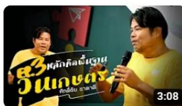
[องค์ความรู้วิชาของแผ่นดิน] Ep 3 หลักคิดพื้นฐานวนเกษตร พิพิธภัณฑ์การเกษตรเฉลิมพระเกียรติฯ การดู 163 ครั้ง • 7 วันที่ผ่านมา